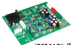
(DSP 24 Bits模組)